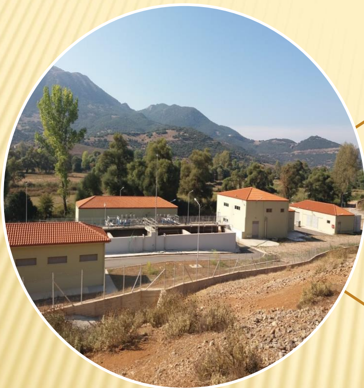
«ΑΠΟΧΕΤΕΥΣΗ ΚΑΙ ΕΠΕΞΕΡΓΑΣΙΑ ΛΥΜΑΤΩΝ ΚΑΛΑΒΡΥΤΩΝ»